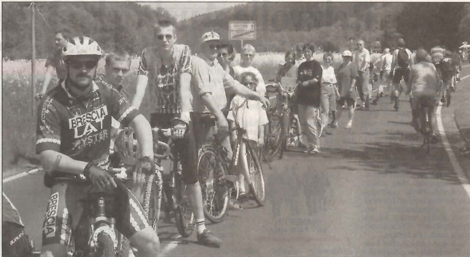
Kein Auto weit und breit: Auf der 8,5 Kilometer langen Strecke, die von Heiligenrode über Uschlag bis Nieste führt, sind Radfahrer, Wanderer und Skater unter sich. Sie ist für Autos gesperrt.