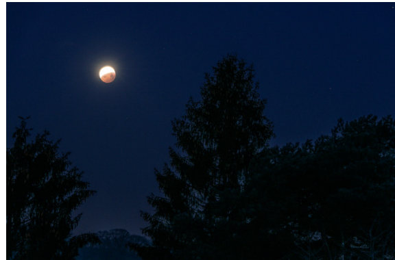
Gut eine Stunde später war der Mond wieder zur Hälfte aus dem Schatten der Erde gewandert. [Dahlheim, 07:10 Uhr]