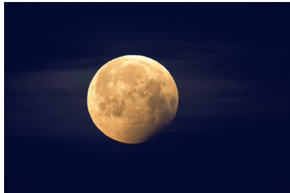
... und dann war der Vollmond wieder sichtbar. [Dahlheim, 07:50 Uhr]