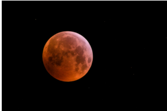
Bei klarem Himmel konnte man am gestrigen Montagmorgen eine totale Mondfinsternis über Dahlheim beobachten. [Dahlheim, 06:05 Uhr]