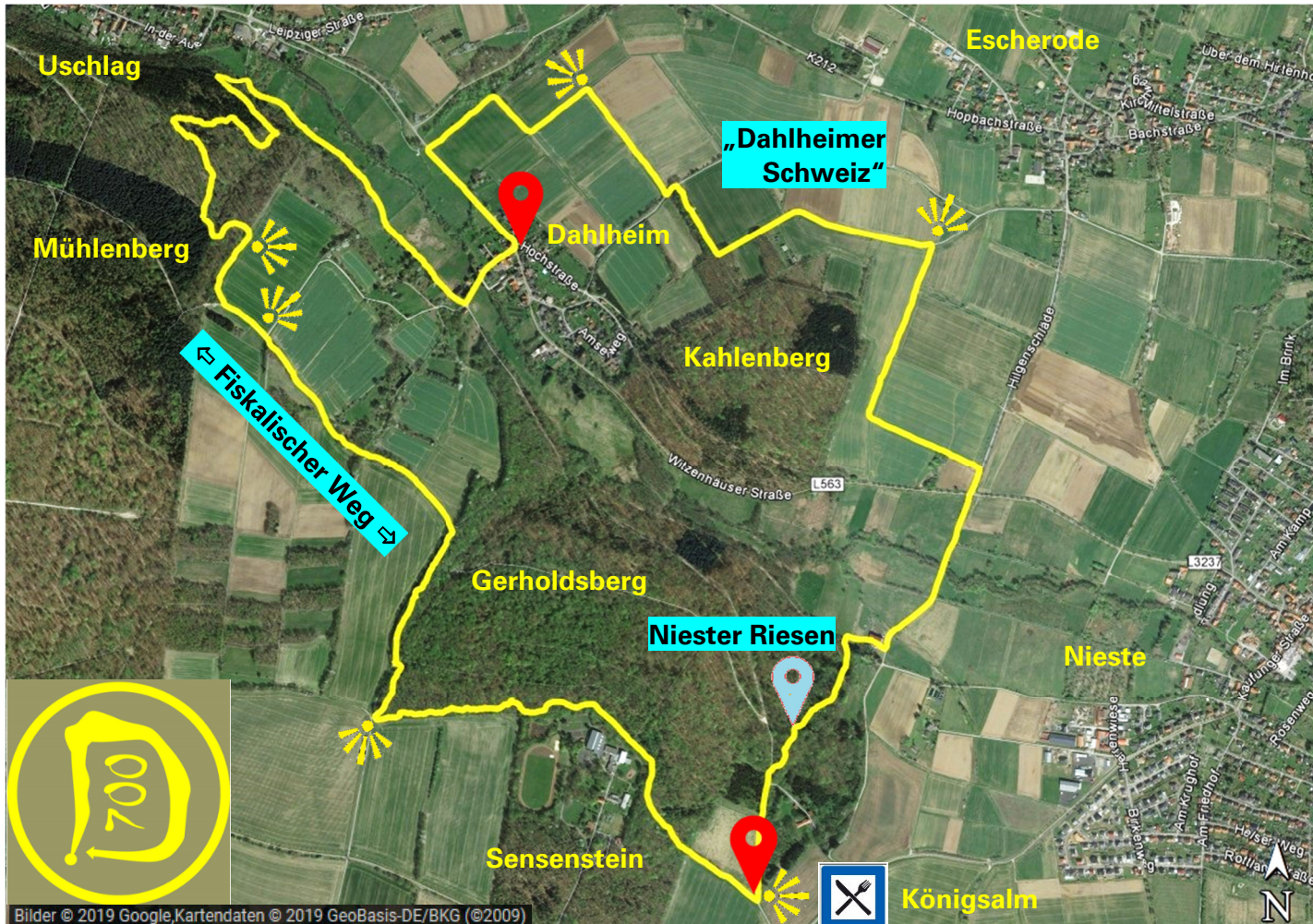
Bilder © 2019 Google, Kartendaten © 2019 GeoBasis-DE/BKG (©2009)