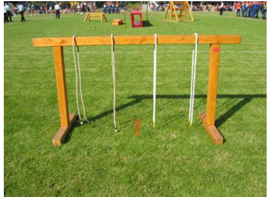
Knotengestell mit 4 Leinen